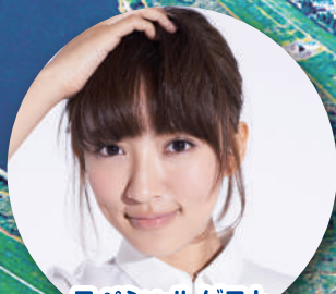
スペシャルゲスト とだPR大使 夏菜さん

Tokyo Yakult Swallows マスコット・ダンスチームが 応援にやってくる! ※雨天時は中止となる場合があります