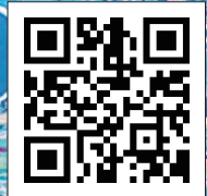
大会ホームページ QRコード